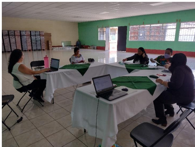
Foto 7 Ejercicio de análisis y evaluación de riesgo de la Asociación Ak' Yu'am. Abril 2022.