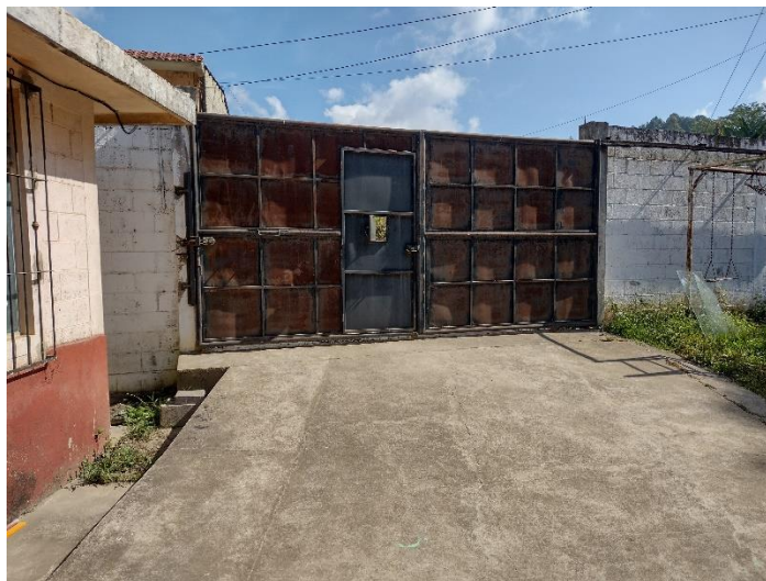
Foto 2 Portón de entrada y salida hacia la calle. Abril 2022