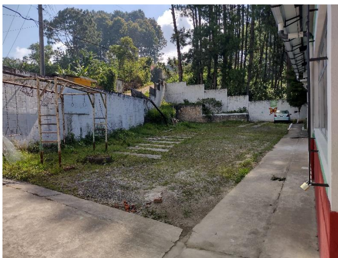
Foto 1 Área de la sede de la organización, parqueo amplio para área segura en casos de emergencia. Abril 2022