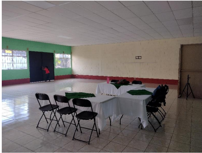
Foto 5 Mobiliario donado con fondos del proyecto Transfórmate, implementado por CARE. Abril 2022.