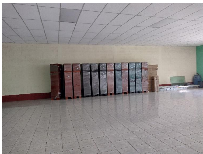
Foto 4 Parte del equipamiento donado a la asociación con fondos del proyecto Transfórmate a través de CARE. Abril 2022.