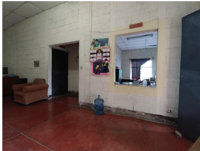
Foto 6 Área de recepción de las oficinas de la asociación. Abril 2022.